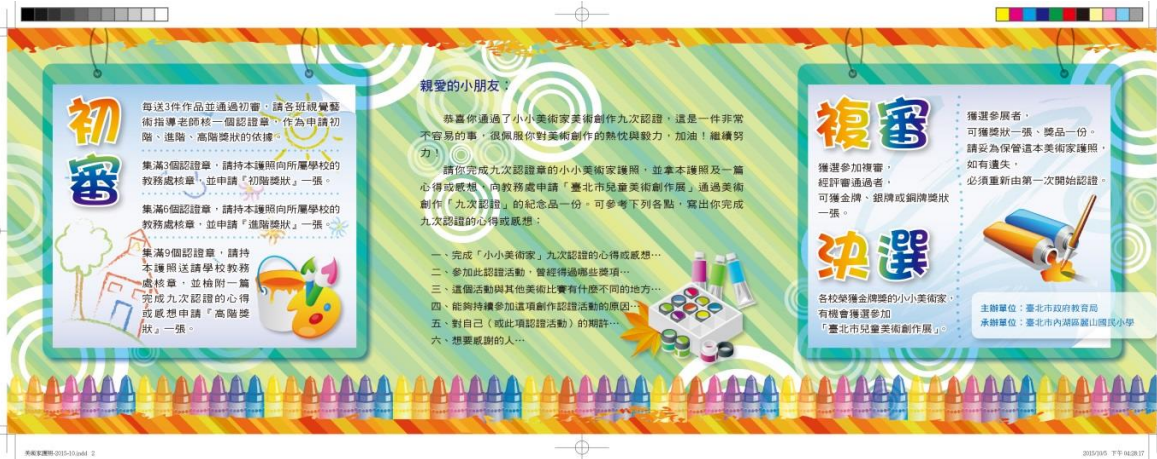
臺北市小小美術家護照樣式[第 1 頁] (上圖為 111 學年度製發樣式，112 學年度無變更樣式)

※本案計畫第五 - 一、- (三)點內容說明各校獲頒高階認證獎狀後仍持續創作受認證獎勵學生，獲校內依附件 1「『小小美術家』認證獎勵」核定通過第 10 次認證起，其參與各年度兒童美術創作展(以下簡稱美創展)，無需參加校內初審及複審作業，直接參與決選報名作業。