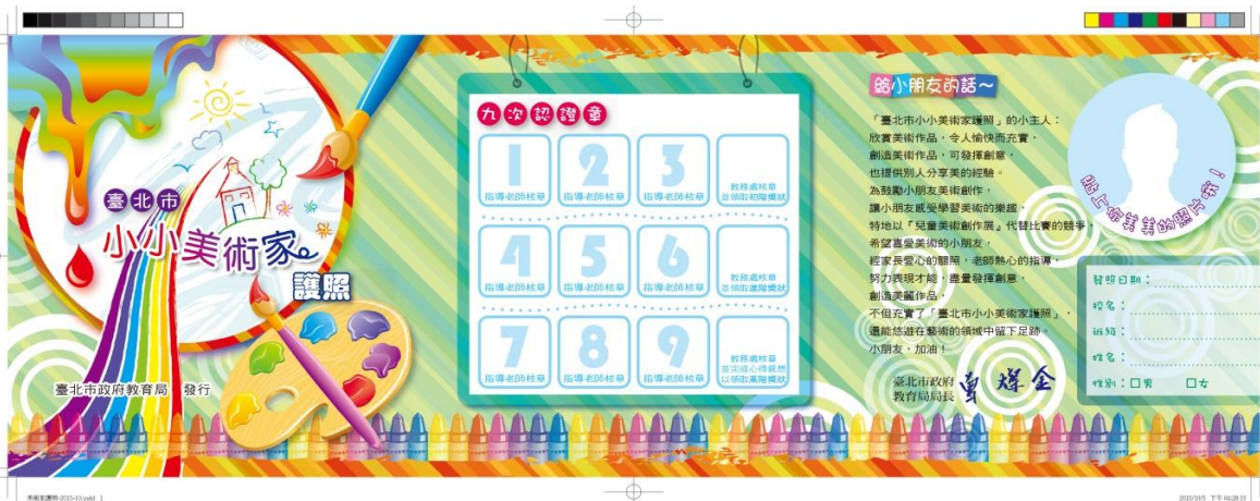
臺北市小小美術家護照樣式[第 2 頁] (下圖為 111 學年度製發樣式，112 學年度無變更樣式)

※請填 112 學年度小小美術家護照需求調查表： https://reurl.cc/XEvvqM